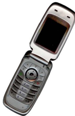
Gambar 3. Contoh gambar dengan resolusi cukup