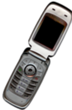
Gambar 2. Contoh gambar dengan resolusi kurang